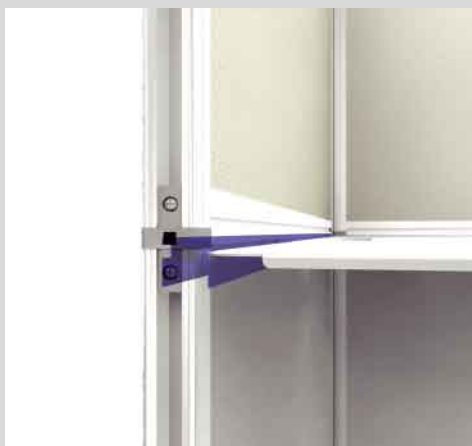
アルミフレームの溝に入れ込むだけの工具いらず。