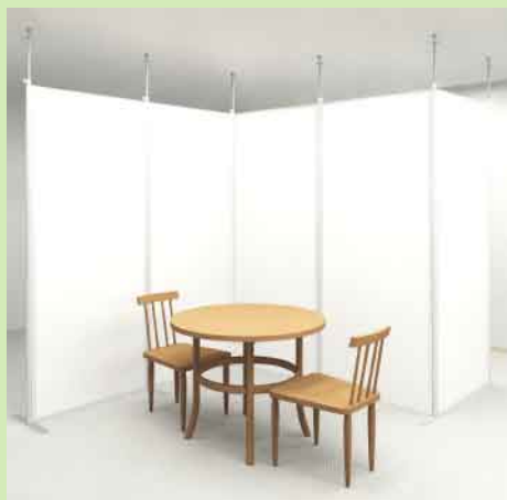
回し易い大き目のノブで無段階調整が可能。

天井にビス止めなどの固定できない場所でも工具なしで突っ張り棒でしっかりと固定できます。