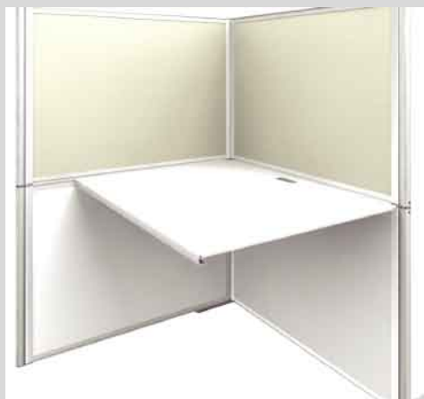
SIKIL に取り付け専用スチール天板。

吸音パネル「OFF TONE」を「SIKIL」に後付する形の従来バージョンから、パネル部に内蔵させる形になり部材点数と後付をする工程を省くことができ、「SIKIL」のコンセプトである組み立てやすさ、運用性を向上させました。