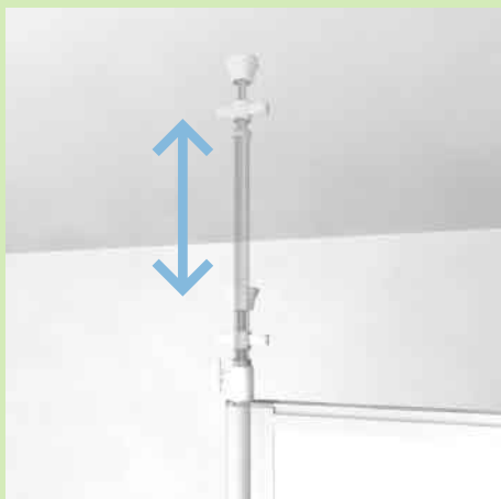
上下伸縮で範囲内の高さを簡単に調整。