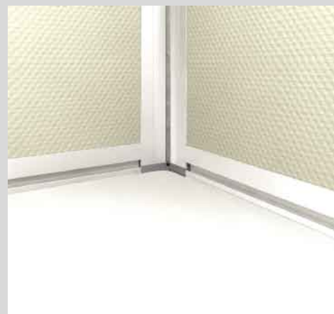
すっきりときれいにおさまります。